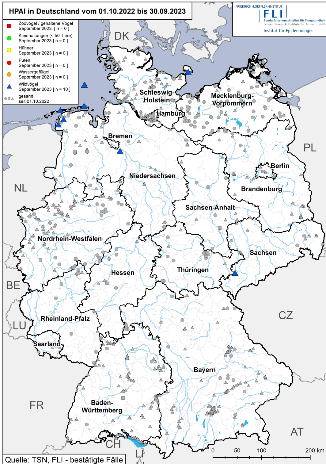
Abbildung 1: Ausbrüche von HPAIV H5N1 in Deutschland bei Geflügel (Punkte), anderen gehaltenen Vögeln (Zoo/Wildtierauffangstation; Quadrate), Fälle bei Wildvögeln (Dreiecke) seit dem 01.10.2022. In Farbe Ausbrüche und Fälle für September 2023. Unterschiedliche Farben: s. Legende. Datenstand: 19.10.2023; Datenquelle: TSN, FLI.