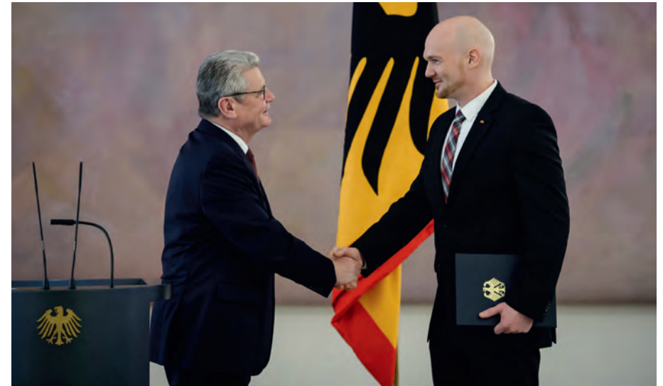
Bundespräsident Joachim Gauck zeichnet den Astronauten Dr. Alexander Gerst am 13. Januar 2015 mit dem Verdienstorden der Bundesrepublik Deutschland aus