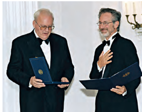
Bundespräsident Roman Herzog überreicht dem amerikanischen Filmregisseur Steven Spielberg für den Film „Schindlers Liste“ das Große Verdienstkreuz mit Stern des Verdienstordens der Bundesrepublik Deutschland am 10. September 1998

Bei Verleihungen im Ausland wird die Aushändigung des Verdienstordens zumeist von den deutschen Botschaftern, die die Vertreter des Bundespräsidenten im jeweiligen Staat sind, vorgenommen.