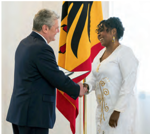
Bundespräsident Joachim Gauck verleiht am 7. März 2013 das Verdienstkreuz am Bande des Verdienstordens der Bundesrepublik Deutschland an Harriet Bruce-Annan anlässlich des Weltfrauentages

Wer seine eigene Auszeichnung anregt, kann nach dem Ordensrecht nicht mit einer Verleihung des Verdienstordens rechnen. Auch kann der Verdienstorden in der Regel nicht posthum verliehen werden.