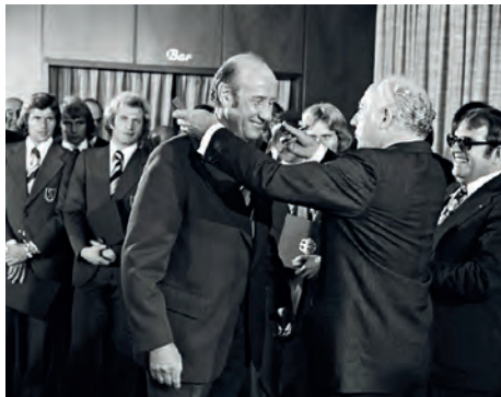
Bundespräsident Walter Scheel überreicht Helmut Schön, Bundestrainer der Fußballnationalmannschaft, anlässlich des Gewinns der Weltmeisterschaft das Große Verdienstkreuz des Verdienstordens der Bundesrepublik Deutschland am 23. September 1974

Der Bundespräsident verleiht den Verdienstorden, händigt ihn aber nur selten persönlich aus. Die Aushändigung delegiert der Bundespräsident unter anderem an die Ministerpräsidenten der Länder, Bundes- oder Landesminister, Regierungspräsidenten, Landräte oder Bürgermeister.