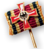
Verdienstkreuz 1. Klasse