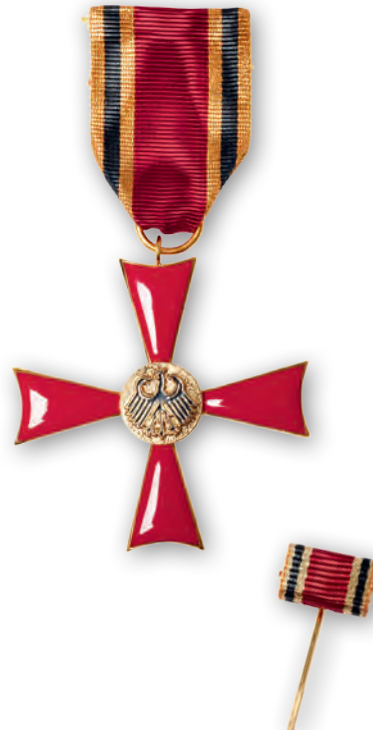
Verdienstkreuz am Bande